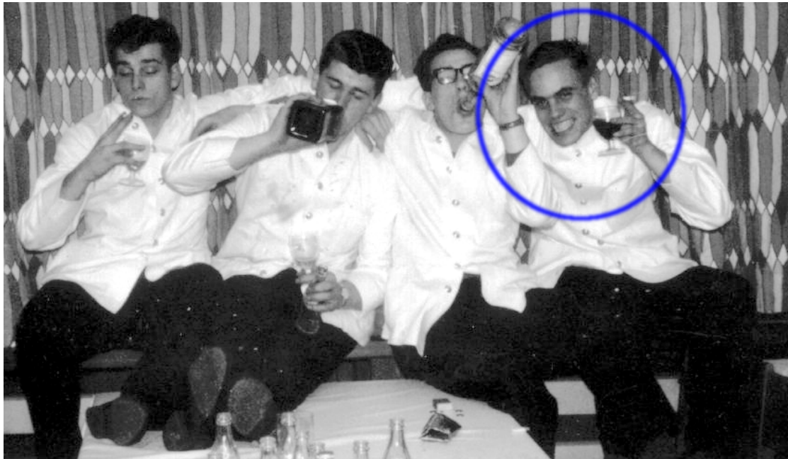
Foto 2: In de mess te Seedorf. ("Dit was na een geslaagd diner. We droegen onze kelnerkledij en deden alsof we dronken waren.")

Sergeanten hadden het wel meer moeilijk met Ads extra privileges, bijvoorbeeld toen hij in burgerkledij uit ging nadat de compagniecommandant hem daarvoor persoonlijk toestemming had gegeven. De burgerkledij maakte het tevens makkelijker voor hem om af en toe sigaretten en alcohol door te verkopen (een liter Bokma jenever